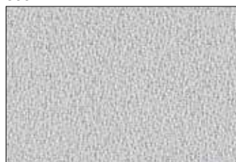
Bianco ghiaccio disponibile solo per le misure 119x44 / 159x44 119x59 / 159x59 119x119 / 119x159