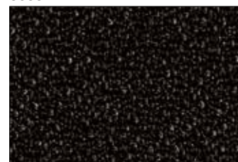
Nero disponibile solo per le misure 119x44 / 159x44 119x59 / 159x59 119x119 / 119x159

* ATTENZIONE: dimensioni 139x59 cm e 179x59 cm disponibili solo nei colori Bianco (0001) - Azzurro (6046) - Grigio Argento (8004) - Grigio Scuro (8007)