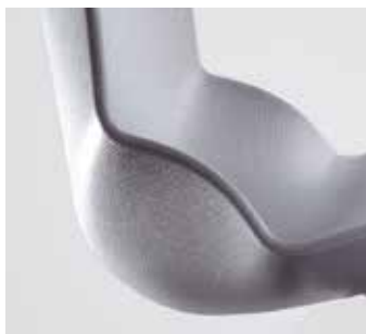
Particolare scocca grigia