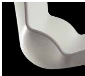
Particolare scocca bianca