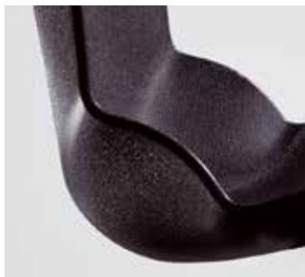
Particolare scocca nera