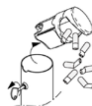
Particolare posacenere asportabile