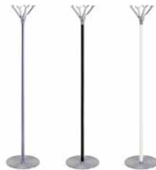
1695-I (GA) 1695-I (N) 1695-I (BO)