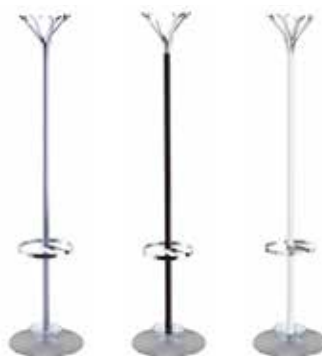
1696-I (GA) 1696-I (N) 1696-I (BO)