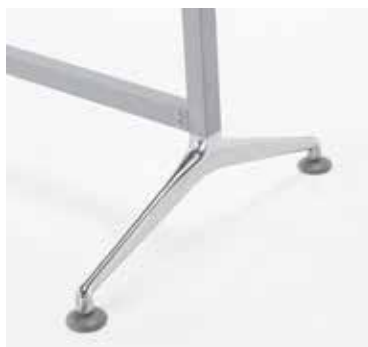
Particolare piede (5210-P, 5210-PBO 5211-P, 5211-PBO)