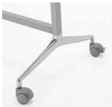
Particolare ruota (5210-R, 5210-RBO 5211-R, 5211-RBO)